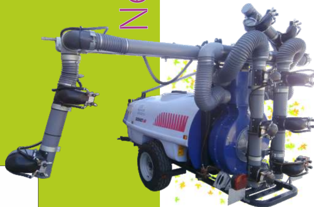
distribuidor de zona