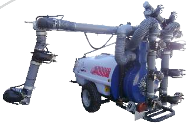
Mod. Multitub Rétractable