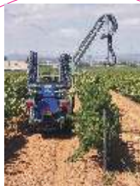
Détail franchir la file