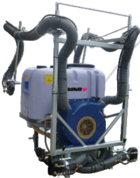
Mod. 4 sorties