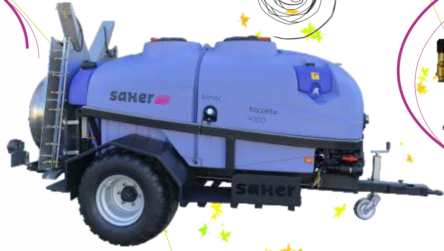
Mod. Torreta Oliviers 4.000 lts. avec des caisses latéraux et garde-boue