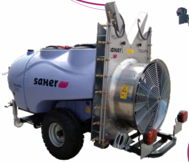
Mod. Torreta Oliviers 2.000 lts.