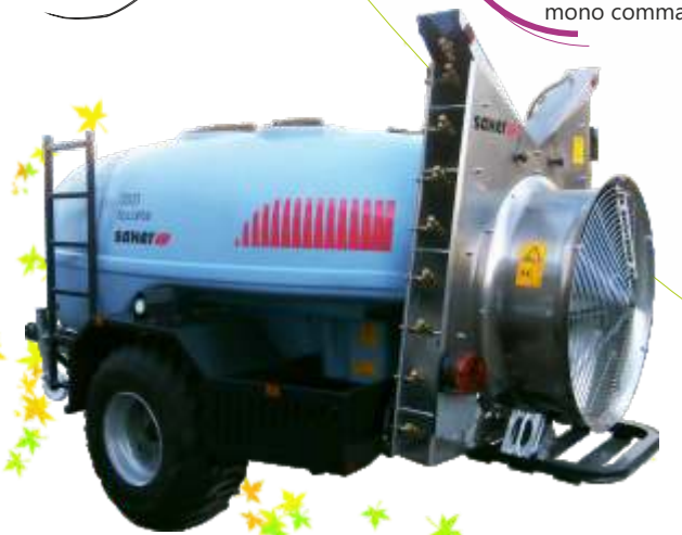
Mod. Torreta Oliviers 3.000 lts. avec des caisses latéraux et garde-boue