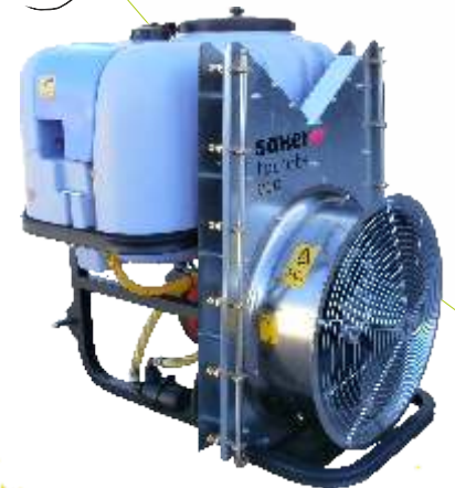
Mod. Multiplicador Torreta. Versión ECO