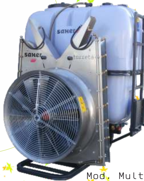
Mod. Multiplicador grupo Torreta