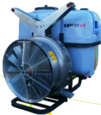
Mod. Grupo multiplicador con alerones V