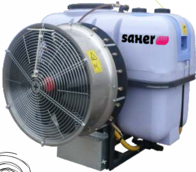
Mod. Grupo correas

Los atomizadores SAHER disponen de un ventilador de 8 aspas regulables que pueden modificar el caudal de aire según las necesidades del cultivo, impulsado por correas o por un multiplicador de 2 velocidades y desconectado. El aire resultante es canalizado mediante 1 cono central de poliéster que equilibra y refuerza su dirección. Un arco de pulverizadores de latón en inoxidable esparcen el producto fitosanitario de forma proporcional y adaptable al cultivo. Recomendado para cultivos de viña y arbóreos.