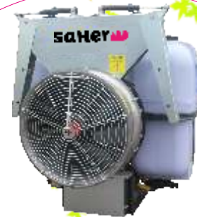
Modelo Grupo correas con alerones