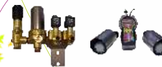
detalle electroválvulas on/off con sonar