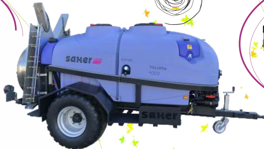
Mod. Torreta Olivos 4.000 lts. con cajones laterales y guardabarros