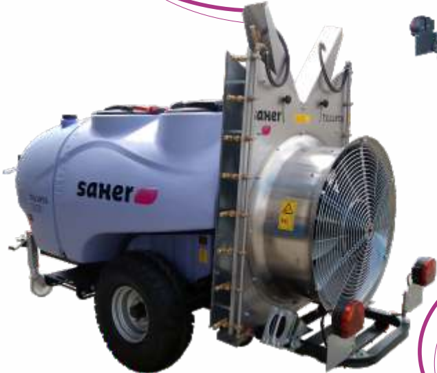
Mod. Torreta Olivos 2.000 lts.