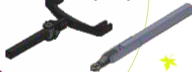
Enganche fijo con anilla