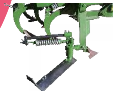
Mecánica con barra fija o pistón plegado