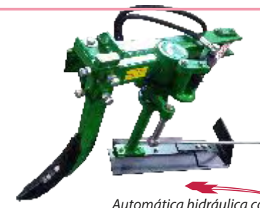
Automática hidráulica con brazo