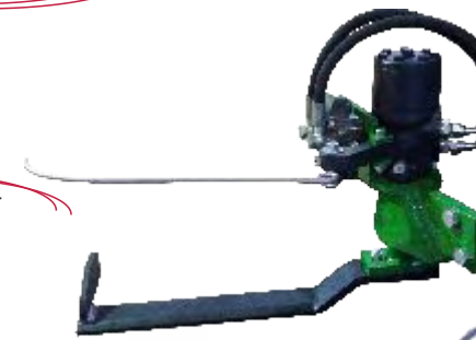
Automática con motor hidráulico